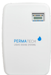
flowDos pro 7-1

Ne serait-il pas formidable de pouvoir surveiller son parc de machines et ses processus en temps réel depuis son bureau? Un rêve qui devient réalité grâce à nos systèmes de dosage. Des rapports détaillés et entièrement automatisés ainsi qu'une documentation continue des processus en font bien entendu partie.