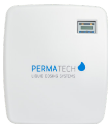
flowDos pro 13-7